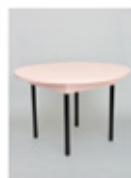
TABLE S *